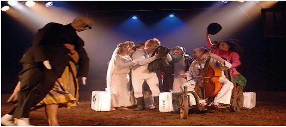
« Zoll » - festival « No Limits », Berlin - 2005